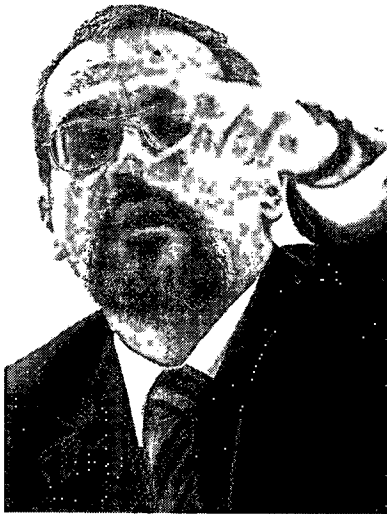
Confusões cometidas por ministro desorganizaram até dialetos bobonistas

Ministro informou notas na manhã de ontem, quando ainda havia veto judicial